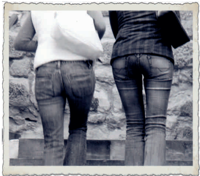
Foto: Der Aufstieg unserer neuen Kollegen, hier die Schlosstreppe zu Rudolstadt.