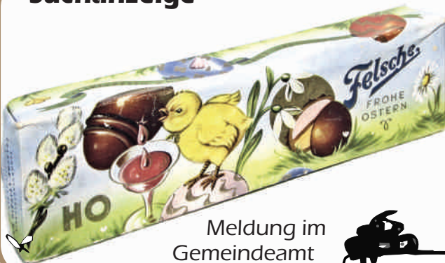
Meldung im Gemeindeamt