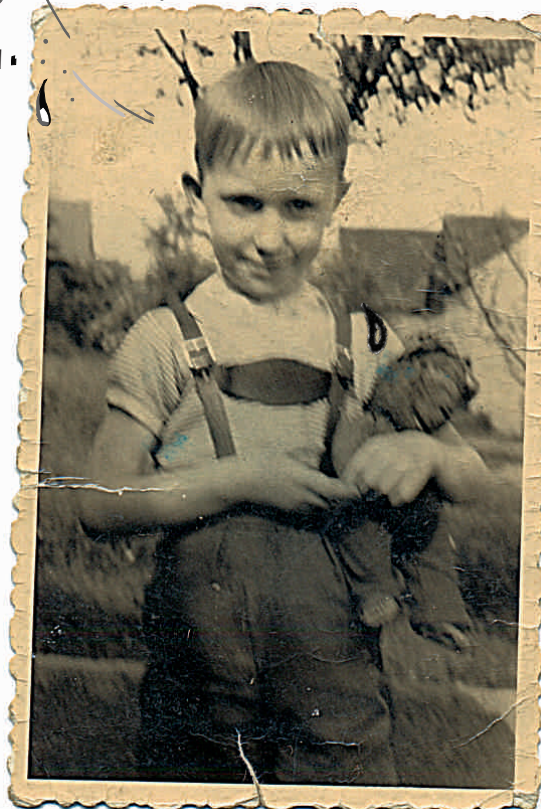
Foto: Der Bürgermeister, als er noch nicht ganz 10 war