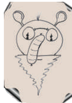
Phantombild des Urthüringers nach der Natur gezeichnet von P.Bock

Lesen Sie noch mehr über das bratwurstessende Glasbläservolk zwischen Rennsteig und Altenburger Land.