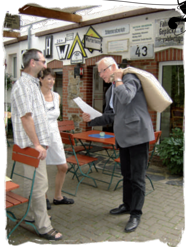
Foto: Der Bürgermeister von Lunzenau, Herr Lindenthal, mit'n Beutel auf'n Rücken.

Eine besondere Überraschung gelang aber unserer Schwesterstadt Lunzenau in Gestalt des sacktragenden Bürgermeisters Franz Lindenthal. Die in der Fülle meiner Aufgaben schon zur Selbstverständlichkeit gewordene Sicherung der Muldenbrücke wurde entgegen der Vereinbarung fürstlich belohnt. 25.000 gr. Weizen trug der scheidende Bürgermeister von Lunzenau quasi als fast