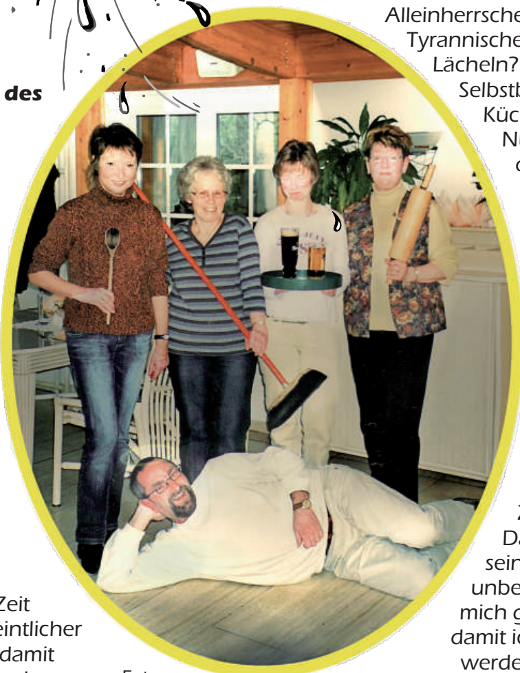
Foto: Der Bürgermeister, seiner Macht-Insignien beraubt.